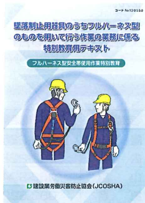
フルハーネス型安全帯使用作業 特別教育用テキスト